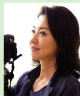
写真家 織作 峰子さん