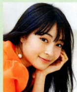
女優 広瀬 すずさん