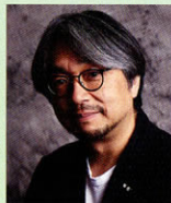
放送作家・脚本家 小山 薫堂さん