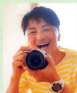
写真家 むらい さちさん