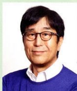
音楽プロデューサー 松任谷 正隆さん