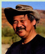
写真家 相原 正明さん