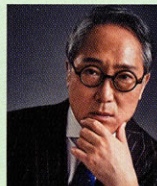
俳優 佐野 史郎さん